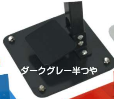
ダークグレー半つや